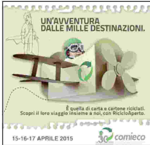
La locandina dell'evento

anniversario importante, che coincide con i 30 anni di attività del Consorzio, durante i quali si è fatto moltissimo per avvicinare e sensibilizzare gli italiani sull'importanza di separare correttamente giornali, buste, scatole, fascette dello yogurt, etichette dei vestiti e qualsiasi frammento in cellulosa possa essere avviato al riciclo. Il risultato è che per ben 8 italiani su 10 la raccolta differenziata è diventata un'abitudine quotidiana che si traduce nel riciclo di oltre 10 tonnellate di macero al minuto. Nella Regione