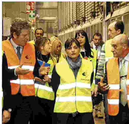
Ecco due momenti della visita della presidente Debora Serracchiani alla Cartiera Rdm Ovaro