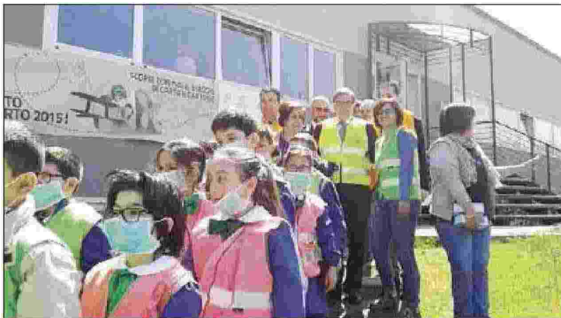
Due momenti dell'iniziativa