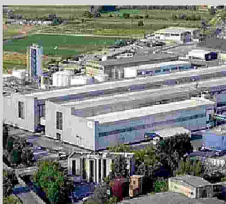
«Porte aperte» alla Ds Smith Paper

zioni, media e a tutti coloro che sono interessati a capire, assistendo in diretta alle varie fasi del processo industriale. «Riciclo Aperto» è alla 15ª edizione e ha l'obiettivo di rassicurare i cittadini sul buon fine della loro raccolta differenziata ed educare i giovani ad un uso più consapevole delle risorse. A Lucca l'impianto visitabile è quello della cartiera DS Smith Paper Spa a Porcari.