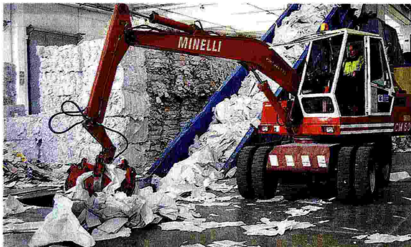
Due «scatti» dell'attività della Gv Macero di Pedrengo. L'azienda recupera ogni mese 6 mila tonnellate di macero e ne commercializza il doppio WWW.CVMACERO.IT